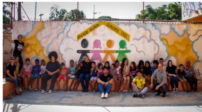
Casa Madre Giovanna (Campo da Tuca) - 95 crianças atendidas