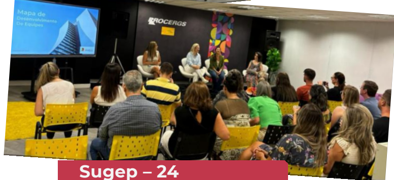
Sugep – 24 lideranças