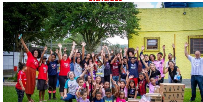
Centro Infante Juvenil Monteiro Lobato (Restinga) - 140 crianças atendidas