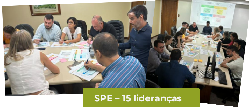
SPE – 15 lideranças