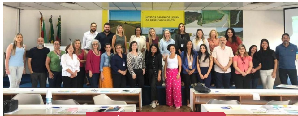
Rede Pessoas – 24 lideranças