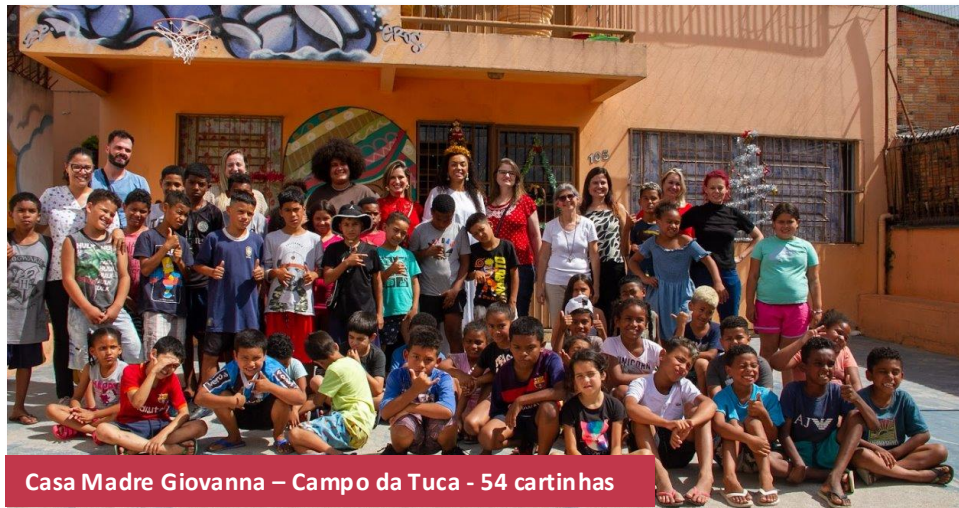
Casa Madre Giovanna – Campo da Tuca - 54 cartinhas