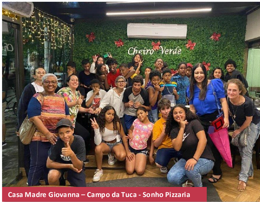
Casa Madre Giovanna – Campo da Tuca - Sonho Pizzaria