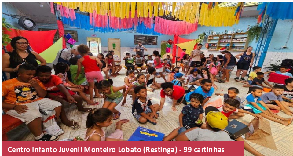
Centro Infante Juvenil Monteiro Lobato (Restinga) - 99 cartinhas