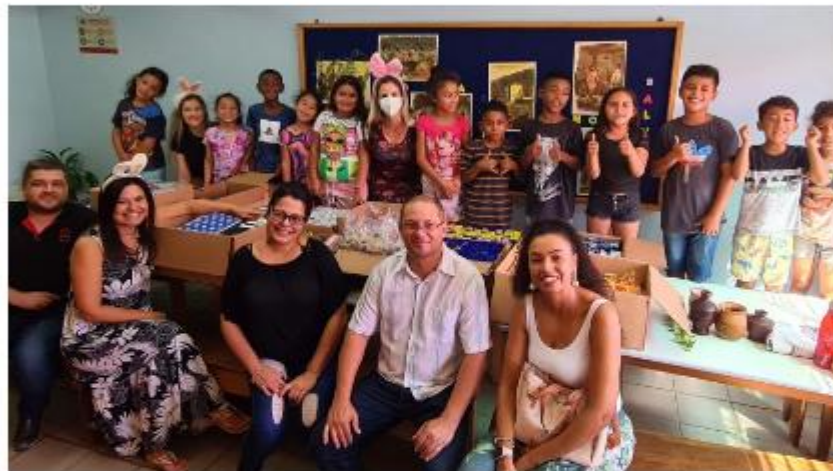
Entrega das doações na Casa Madre Giovanna, no Campo da Tuca, em Porto Alegre

A entrega de 525 caixas de chocolates, 140 bolos artesanais e dezenas de materiais escolares na Casa Madre Giovanna, instituição localizada no Campo da Tuca, em Porto Alegre, marcou o encerramento nesta quarta-feira (12) da campanha Páscoa Solidária 2023. Realizada pelo terceiro ano seguido, a corrente de solidariedade dos servidores do governo estadual tem por objetivo a arrecadação de materiais escolares e chocolates para crianças. Além da Casa Madre Giovanna, neste ano o Centro Infante Juvenil Monteiro Lobato, no bairro Restinga, na Capital, também recebeu os produtos, em entrega realizada no dia 4 de abril.